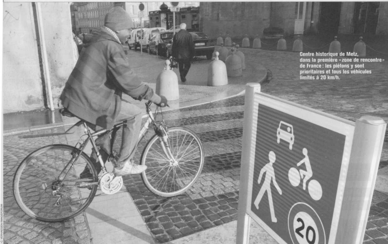
Centre historique de Metz, dans la première « zone de rencontre » de France : les piétons y sont prioritaires et tous les véhicules limités à 20 km/h.