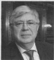
Dominique Braye, sénateur (UMP) des Yvelines

«Il faut détaxer les tonnages sur lesquels la collectivité ne peut agir. Même après un recyclage poussé, même dans un schéma multifilières cohérent, il restera encore environ 50% du gisement initial. Pour ces déchets, l'incinération avec valorisation