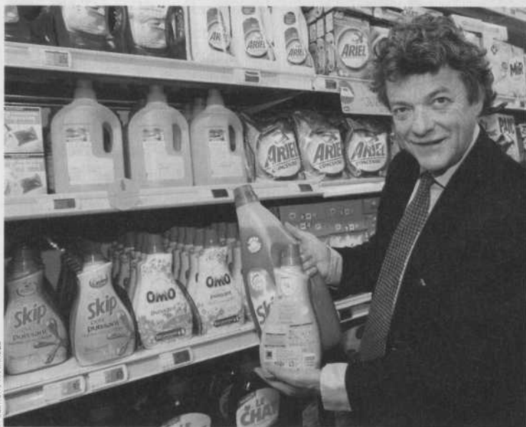
La baisse de production des déchets commence par l'écoconception des biens de consommation courante. Ci-dessus, Jean-Louis Borloo, ministre de l'Écologie.

La « nouvelle » TGAP, adoptée fin 2008, a pris de court les collectivités. Les parlementaires peaufinent les amendements, en vue de la prochaine loi de finances.