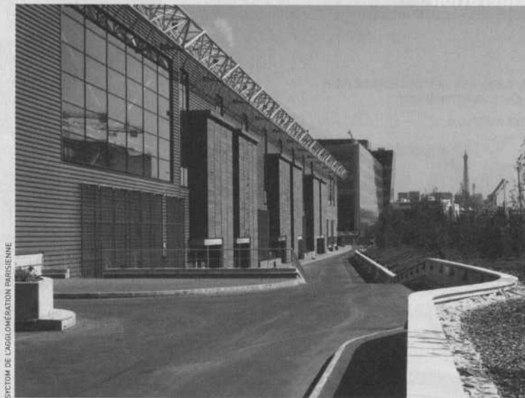
Les émissions d'oxydes d'azote sont déjà plafonnées à 80 mg/Nm3 pour les usines de l'agglomération parisienne, comme à Issy-les-Moulineaux (Isséane).

La nouvelle taxe est d'autant moins pénalisante que les usines modèrent leur impact environnemental.