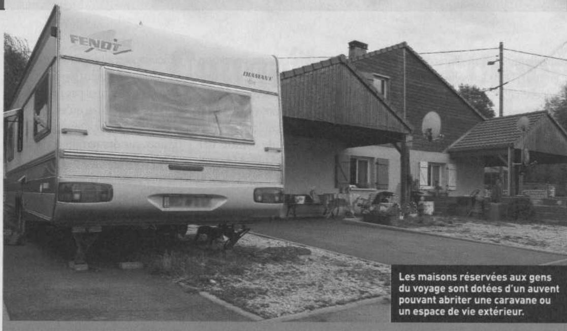
Les maisons réservées aux gens du voyage sont dotées d'un auvent pouvant abriter une caravane ou un espace de vie extérieur.