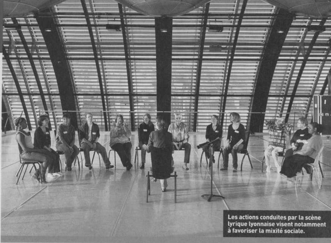
Les actions conduites par la scène lyrique lyonnaise visent notamment à favoriser la mixité sociale.